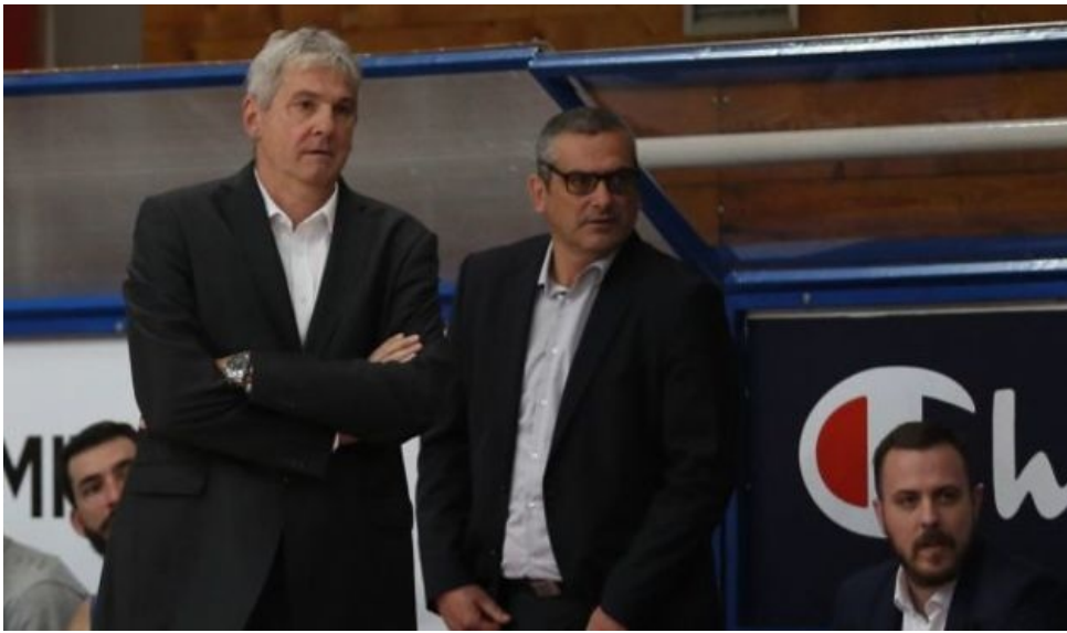
košarka, aba liga